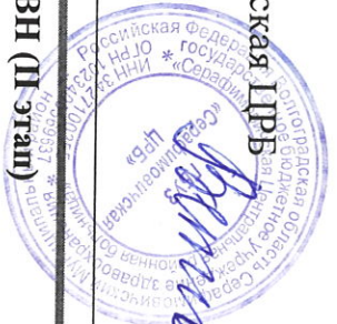
Схема маршрутизации пациентов при прохождении ДОГВН (II этап)

по адресу: часы работы: ежедневно с 8:00 до 20:00, суббота с 8:00 до 15:00